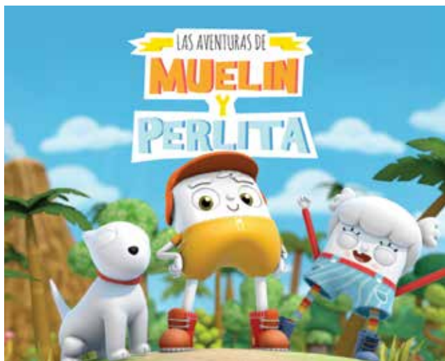
"Las aventuras de Muelín y Perlita", de Punkrobot Studio.

Desarrollar series animadas de televisión con equipos de trabajo pequeños a partir de ideas originales, en muchas ocasiones en co-producciones con países vecinos y luego recibir el reconocimiento de canales y productoras internacionales, se ha vuelto algo cotidiano.