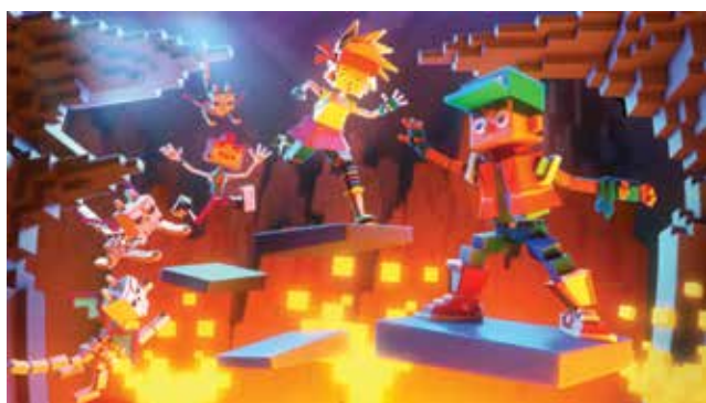
"Super Bit Quest", de Punkrobot Studio.