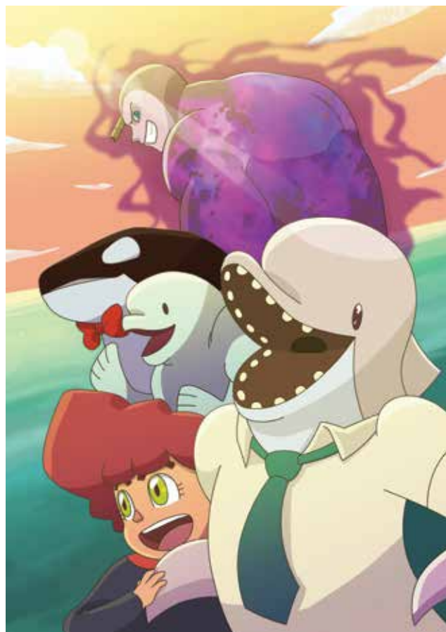
“Personas Cetáceas”, de Marmota Studio.