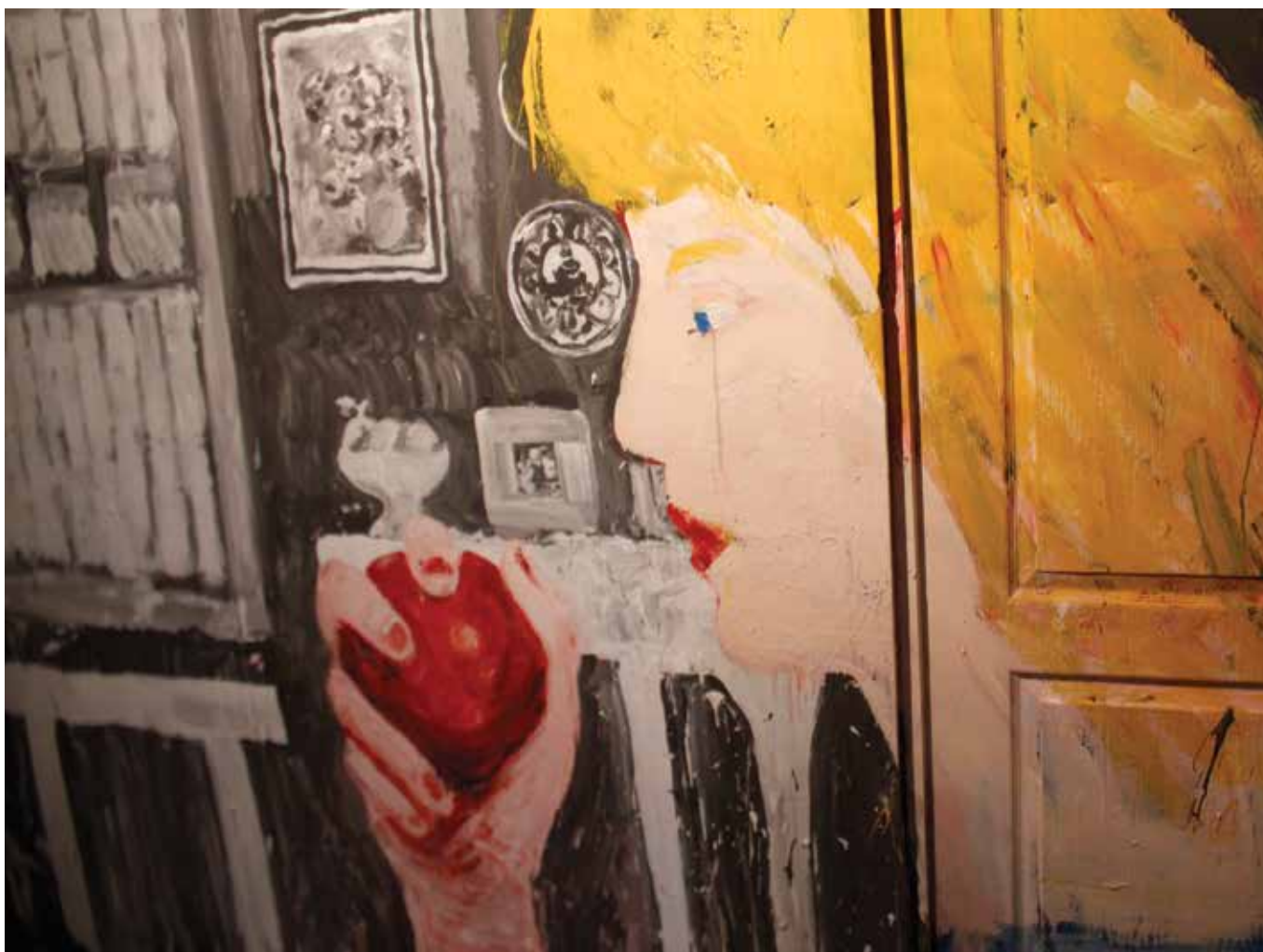
"La Casa Lobo", de la productora Diluvio.

La realización de este largometraje, que también tiene fecha de estreno para el año 2017, se ha llevado a cabo en estudios ubicados en varios espacios de exhibición y galerías, por lo que el público ha podido ver el proceso como un trabajo en constante cambio y la producción misma se ha transformado en una pieza artística.