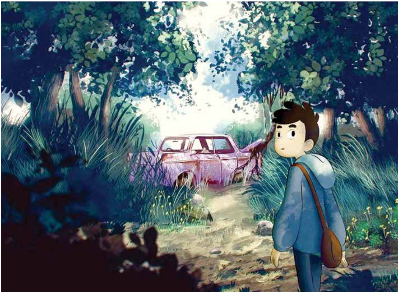
"Nahuel y el Libro Mágico", de la productora Carburadores en co-producción con Punkrobot Studio.

Como reflejo de la versatilidad local, los tres largometrajes actualmente en producción son para audiencias completamente