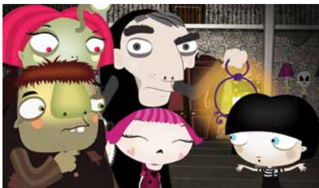
"Hostal Morrison", de la productora Pájaro.

India Catalina con el galardón a Mejor Serie Animada y Mejor Arte en una serie. Actualmente el proyecto espera su fecha de estreno en Brasil y Argentina, países que en conjunto con Chile y Colombia, son parte de esta co-producción cuatripartita.