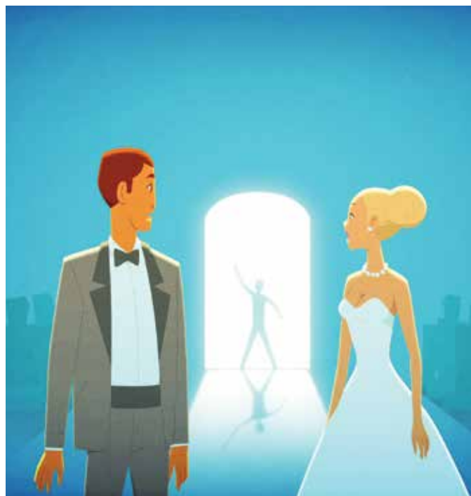
Escenas del cortometraje 'Love', de la productora Fluor.