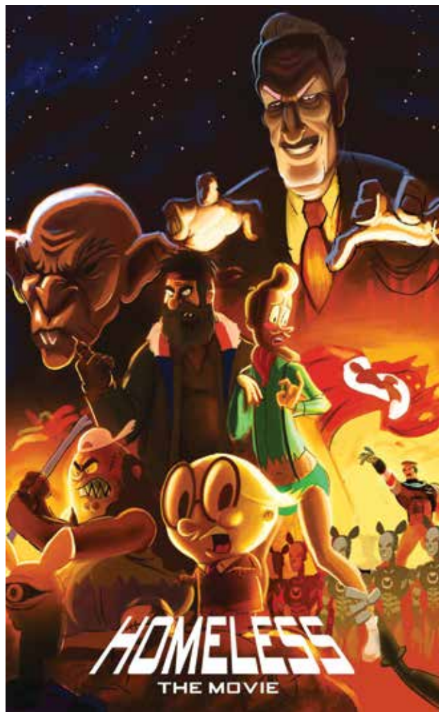
“Homeless”, de la productora Lunes.

Finalmente y en una arista completamente diferente, otro de los proyectos actualmente en desarrollo es “La Casa Lobo” de Diluvio, una productora audiovisual que viene desde el mundo del arte,