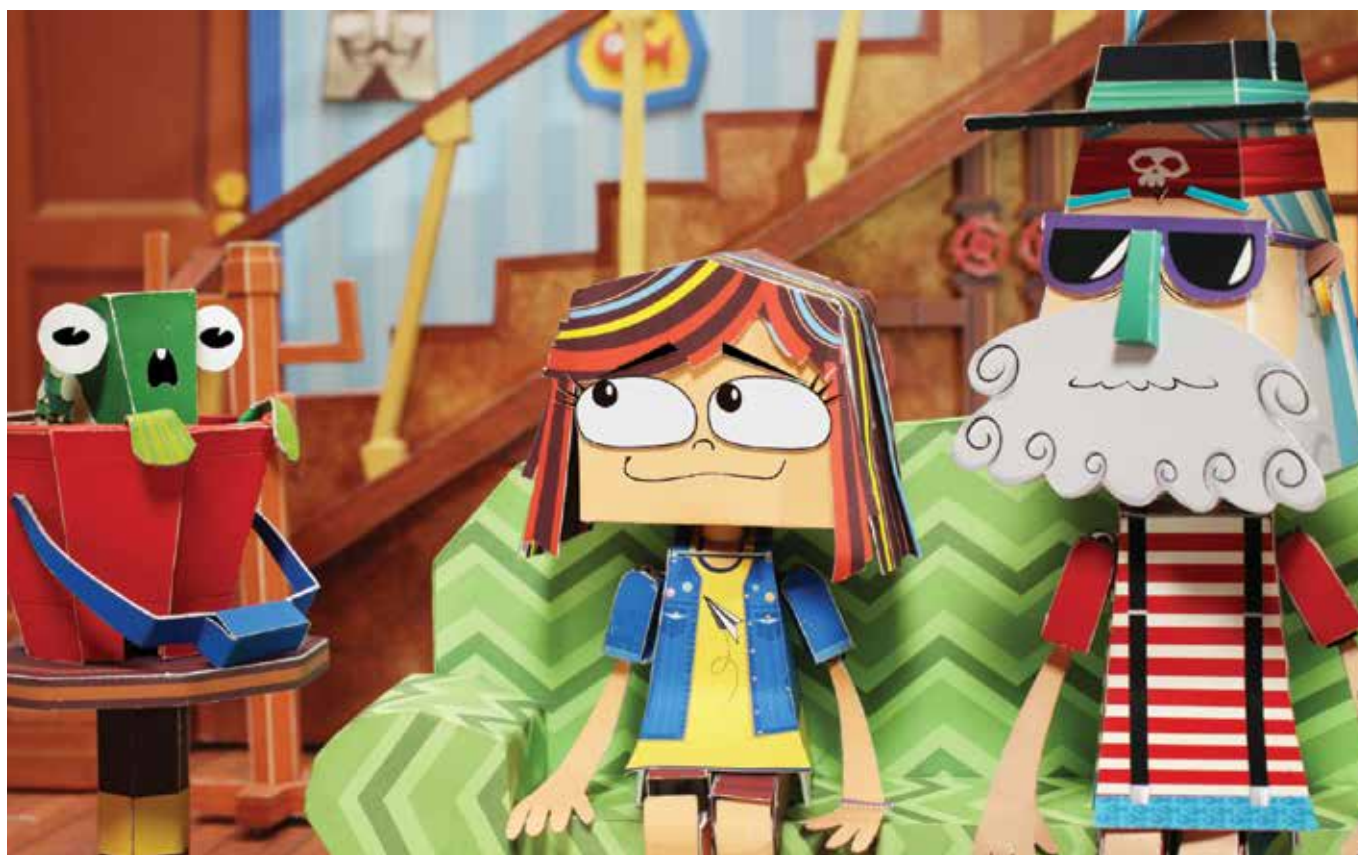
“Puerto Papel”, de la productora Zumbastico Studios.

En esta edición del festival es la ya galardonada serie “Puerto Papel”, de la productora Zumbastico Studios, la que busca un nuevo triunfo para Chile. El proyecto cuenta la historia de Matilde, una niña común y corriente que se va a pasar las vacaciones con su abuelo a Puerto Papel y que, tras tocar un coco mágico, despierta todos los días con un nuevo misterioso superpoder que no puede controlar. Ahora Matilde, con la ayuda de sus amigos, deberá enfrentarse a los problemas y aventuras que se le presentan producto de su nueva habilidad. Esta serie, realizada en stop motion con figuras de papel y con efectos en 3D y 2D, se presenta a la competencia siendo ya emitida no sólo en Chile sino que también en Colombia. En este país fue reconocida por los premios